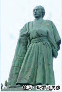
桂浜・坂本龍馬像