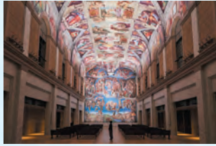
写真は国際美術館の展示作品を撮影したものです

松山城は、江戸時代前に建造され12天守を有する城郭、お遍路さんも多く参拝する石手寺を巡ります。