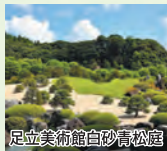
足立美術館 白砂青松園