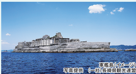
軍艦島(イメージ)