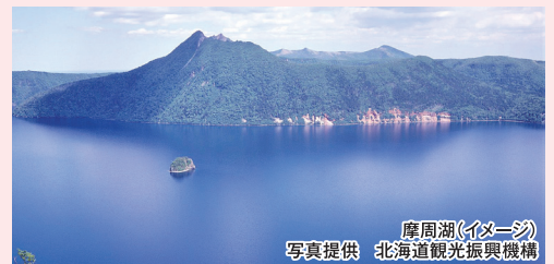
摩周湖(イメージ)