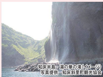
知床半島・湯の華の滝(イメージ)