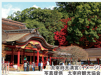
太宰府天満宮(イメージ)