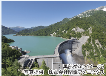
黒部ダム(イメージ)

清流と名水の城下町「郡上八幡」、古い町並みと祭の「飛騨高山」、世界遺産「白川郷」、トロッコ電車での「黒部渓谷」、専用乗物を6回利用する「黒部アルペンルート」。そして南木曽路「妻籠宿」「馬籠宿」、国宝「松本城」と、見どころ満載の4日間を名古屋空港往復の飛行機利用で快適に過ごします。