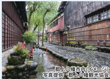
郡上八幡市内(イメージ)