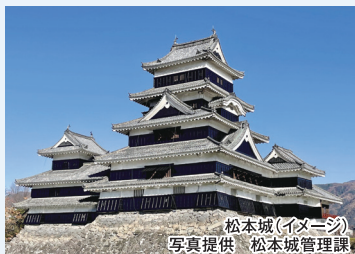
松本城(イメージ)