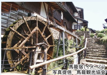
馬籠宿(イメージ)