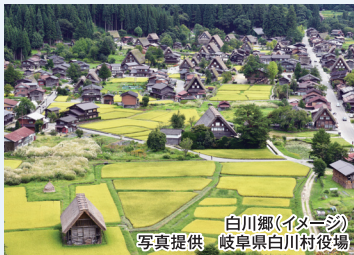
白川郷(イメージ)