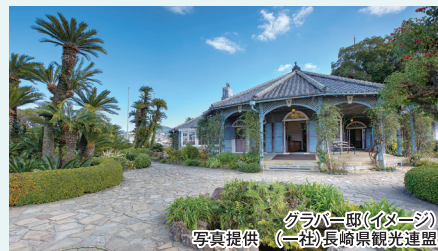
グラバー邸(イメージ)