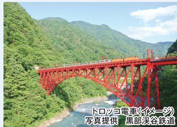
トロッコ電車(イメージ)