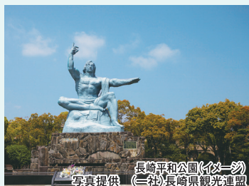
長崎平和公園(イメージ)