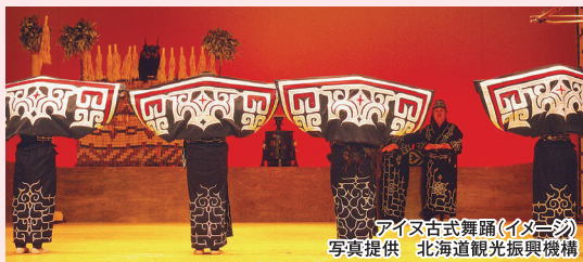
アイヌ古式舞踊(イメージ)

テレビ小説の舞台となった十勝では、雄大な丘に花と自然風景がコラボする十勝ヒルズでの庭園散策、中世ヨーロッパの古城を思わせる池田ワイン城にてワイナリーの施設見学にご案内します。マリモが息息する阿寒湖では湖上遊覧と北海道でも最大のアイヌ集落を訪れ、「アイヌ古式舞踊」の鑑賞をお楽しみいただきます。日本一の透明度を誇るカルデラ湖「摩周湖」から、世界自然遺産の知床国立公園にご案内し、観光船に乗って陸路からでは見られない断崖絶壁や壮大な海の風景をご覧ください。最終日は、知床五湖を探勝する「高架木道」を渡り、知床連山の大パノラマを観ながら第一湖までご案内します。網走では、国内唯一の監獄ミュージアム「博物館網走監獄」、流水の天使と呼ばれる「クリオネ」を飼育展示する「オホーツク流水館」へご案内いたします。