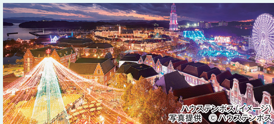
ハウステンボス(イメージ)

ヨーロッパの街並みを再現したテーマパーク「ハウステンボス」夜は光の王国イルミネーションを、満喫します。長崎市内では、長崎平和公園・世界遺産登録「軍艦島上陸見学とグラバー邸」史跡・名所をめぐる。福岡では、学問の神様太宰府天満宮、高さ（234m）福岡タワーへご案内します。