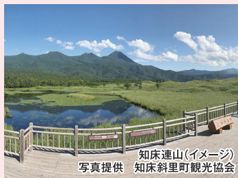
知床連山(イメージ)