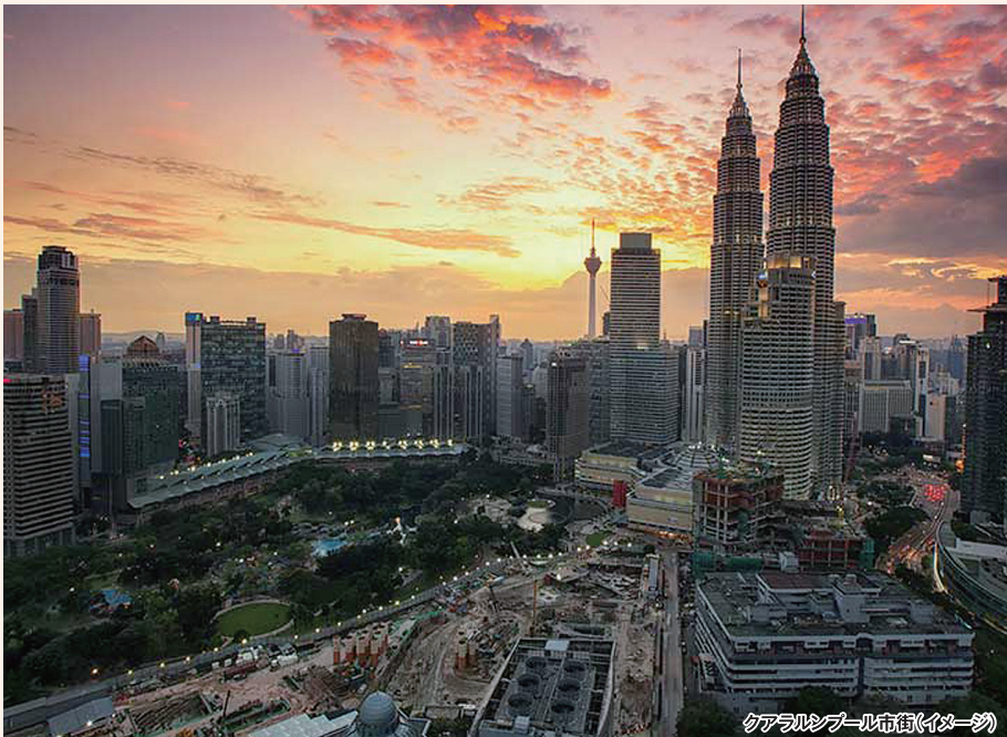
クアラルンプール市街(イメージ)