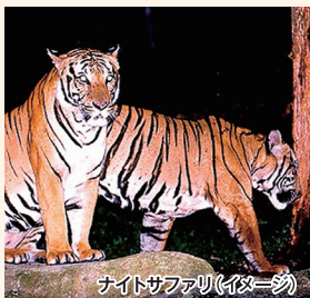
ナイトサファリ(イメージ)