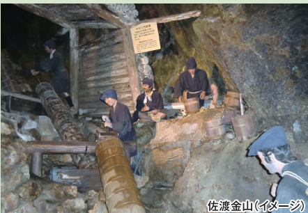
佐渡金山(イメージ)