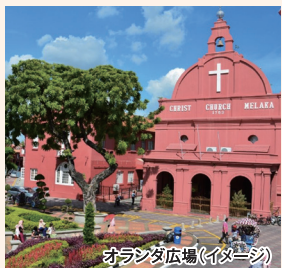
オランダ広場(イメージ)