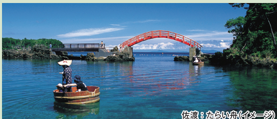
佐渡：たらい舟(イメージ)

金山の島として栄えた佐渡ヶ島。江戸時代に開山され、400年以上の歴史を誇ります。島内各地の変化に豊かな自然豊かな景勝地・歴史的スポットなどを巡ります。その後は、毎分4,000リットルの源泉「湯畑」をもつ、名泉「草津温泉」へ。避暑地軽井沢・「旧軽井沢銀座」へご案内します。