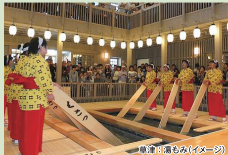
草津：湯もみ(イメージ)