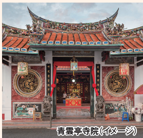
青雲亭寺院(イメージ)