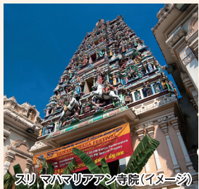
スリ マハマリアマン寺院(イメージ)