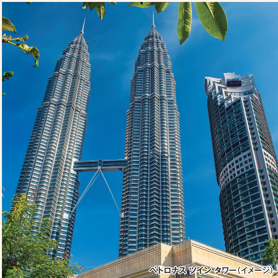
ペトロナス ツインタワー(イメージ)

訪れるたびに新しい発見があるシンガポール、そして日本人が住みたい国で常に上位に食い込むマレーシアの人気都市マラッカとクアラルンプールを周遊します。シンガポールでは、2015年に同国初の世界遺産となった世界最大規模の蘭園「ボタニックガーデン」、話題のマリーナベイサングスの「スカイパーク展望台」、世界初の夜の動物園「ナイト・サファリ」、そしてアジア最大級のリゾートアイランド「セントーサ島」など見逃せない観光スポットへご案内します。マラッカは14世紀末から東西貿易の中継地として栄え、16世紀になるとポルトガルやオランダ、イギリスなど、ヨーロッパの列強国による支配を受けるようになりました。その支配時代のヨーロッパ文化とマレー文化が融合された独特な街並みは、2008年に世界文化遺産に登録されました。クアラルンプールはマレーシアの首都であり、近年急速に発展を遂げており東南アジア有数の世界都市です。旧中央駅を中心に広がる美しいムア建築やペトロナスツインタワーをはじめとする近代建築と自然が見事に調和された美しい都市です。