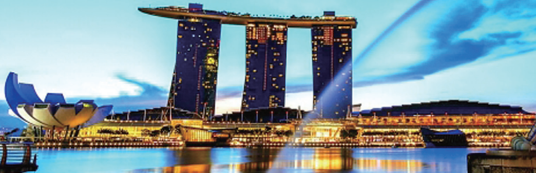
シンガポール(イター勢)

佐渡ヶ島周遊と名湯草津温泉の旅では、自然豊かな景勝地・歴史的スポットなどを巡ります。その後は、名泉「草津温泉」へ。避暑地軽井沢・「旧軽井沢銀座」を巡っていきます。熊本の旅では、地震に耐えた、今しか見られない熊本城の雄姿をご覧いただきながら、復興支援を行います。宮崎県では、高千穂町にご案内し、高千穂峡のシンボル「真名井の滝」を見学します。史跡巡りの後は、南国の太陽が降り注ぐ日南海岸へのご案内します。各史跡を巡りながら、話題の「西郷どん大河ドラマ館」へのご案内します。シンガポールの旅では、マレーシアの人気都市マラッカとクアラルンプールを周遊します。世界最大規模の蘭園「ボタニックガーデン」、話題のマリーナベイサンズの「スカイパーク展望台」、世界初の夜の動物園「ナイト・サファリ」、そしてアジア最大級のリゾートアイランド「セントーサ島」など見逃せない観光スポットが満載です。マラッカの独特な街並みは、2008年に世界文化遺産に登録されました。クアラルンプールは美しいムア建築やペトロナスツインタワーをはじめとする近代建築と自然が見事に調和された美しい都市です。心行くまでご満喫下さい。