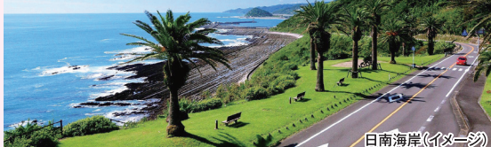
日南海岸(イメージ)