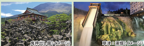
鬼押出し園(イメージ)