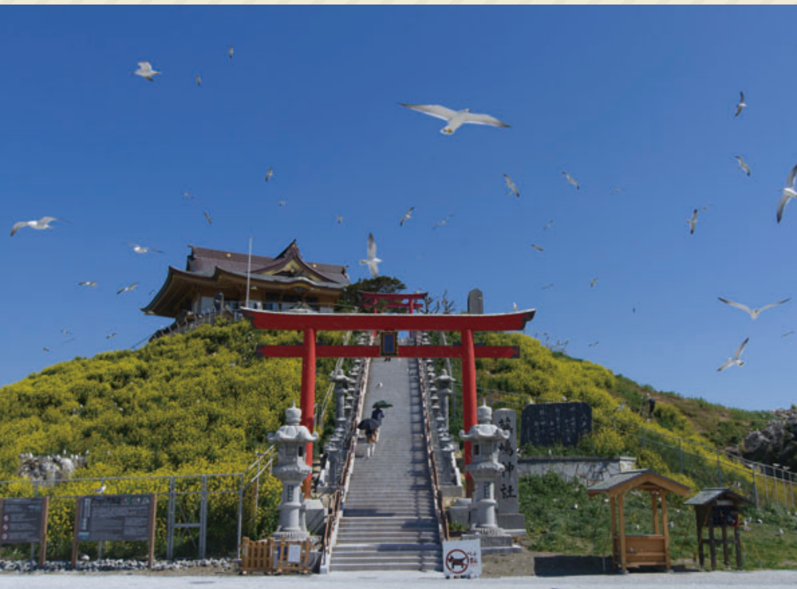
表紙写真：八戸市蕪島

発行：一般財団法人青森県市町村職員福祉互助会 〒030-0802 青森県青森市本町五丁目1番5号 TEL017-723-6527 FAX 017-723-5619