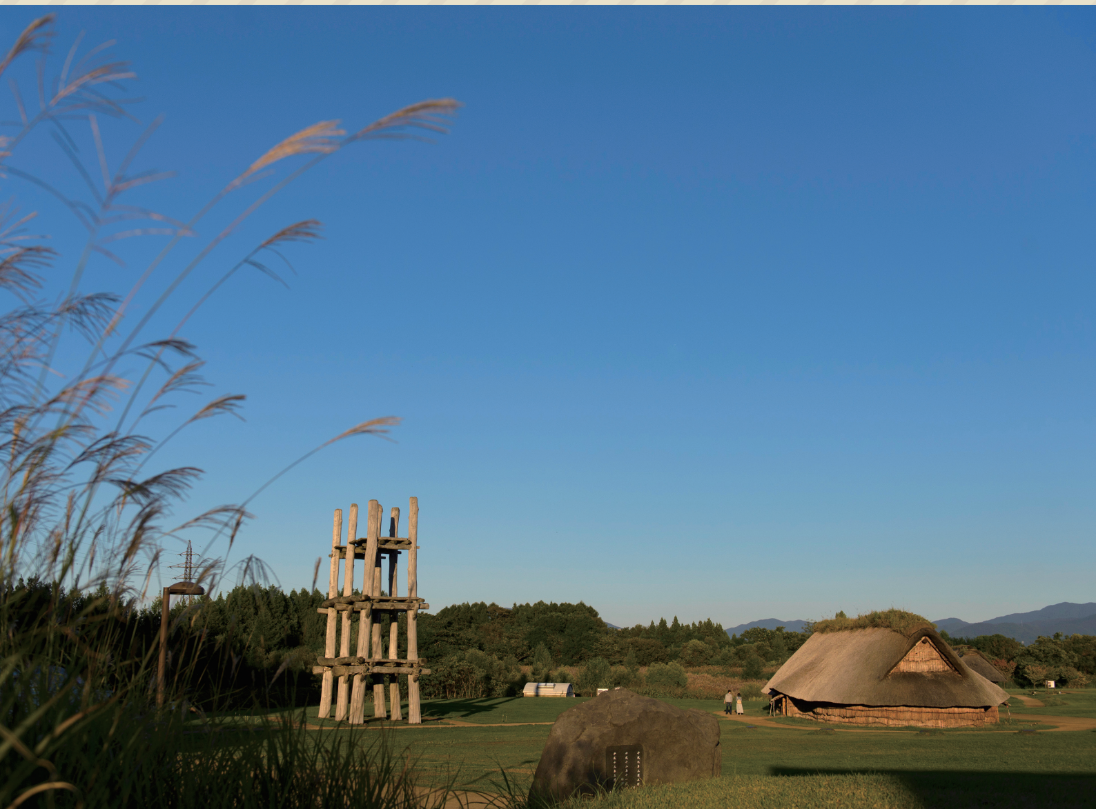
表紙写真：三内丸山遺跡

発行：一般財団法人青森県市町村職員福祉互助会 〒030-0802 青森県青森市本町五丁目1番5号 TEL017-723-6527 FAX 017-723-5619