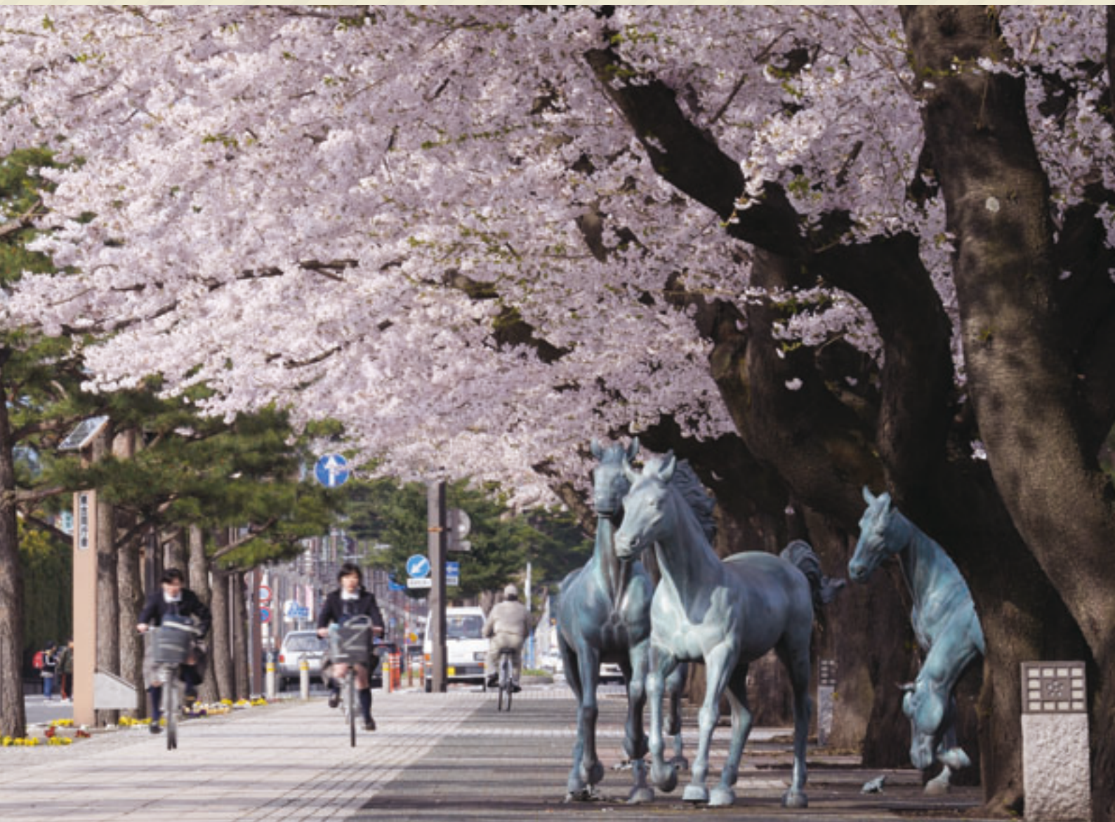
表紙写真：十和田市官庁街通りの桜

発行：一般財団法人青森県市町村職員福祉互助会 〒030-0802 青森県青森市本町五丁目1番5号 TEL017-723-6527 FAX 017-723-5619